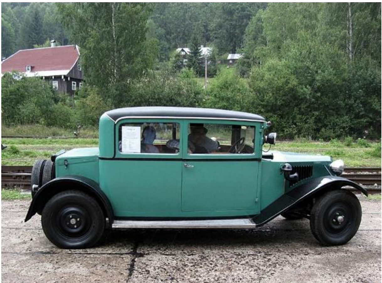
Karosserie Typ „Lang“ nur 3 Exemplare sind heute bekannt