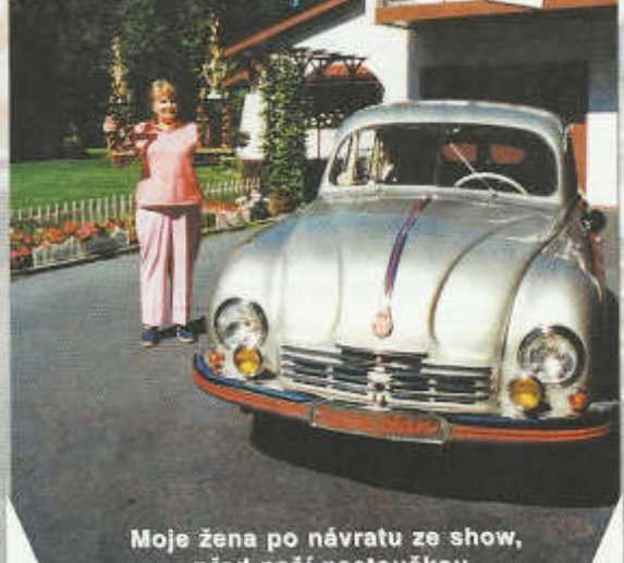
Moje žena po návratu ze show, před naší pastouškou