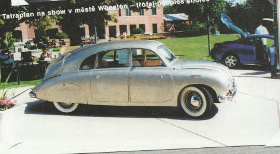
Tatraplán na show v městě Wheaton - trofej: Peoples choice