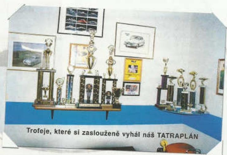
Trofeje, které si zaslouženě vyhál náš TATRAPLÁN