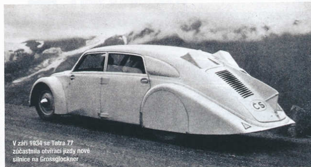
V září 1934 se Tatra 77 zúčastnila otvírací jízdy nové silnice na Grossglockner

Chlazení osmiválce zajišťovala dvojice ventilátorů umístěných po obou stranách motoru. Elektrická soustava vozu pracovala s napětím 12 V. Bubnové brzdy měly kapalinové ovládání, ruční brzda působila mechanicky na zadní kola. Při rozvoru náprav 3150 mm a rozchodu kol 1300 mm byla Tatra 77 dlouhá 5150 mm, široká 1700 mm a vysoká 1520 mm a vykazovala pohoto-