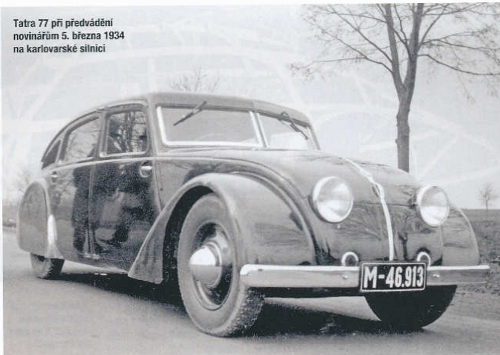
Tatra 77 při předvádění novinářům 5. března 1934 na karlovarské silnici