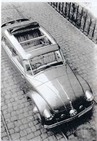
Tatra 77 A ročníku 1936 s přepážkou za řidičem a shrnovací střechou Webasto

vostní hmotnost kolem 1750 kg. Pod víkem v zaoblené přídi měla palivovou nádrž o objemu 80 l a vodorovně nad sebou uložená dvě náhradní kola. Prostor pro zavazadla byl jen vzadu, za opěradlem zadního sedadla. Vzhledem k velkorysé vnitřní šířce karoserie byl vůz označován jako šestimístný, se třemi místy na předním i na zadním sedadle.