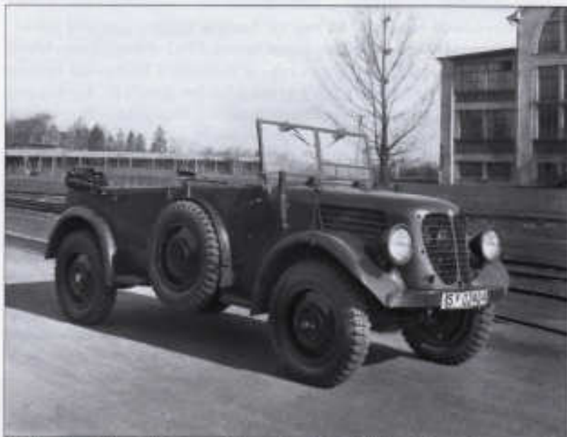
V 809 zachoval původní koncepci konstrukce dělostřeleckého průzkumného automobilu.