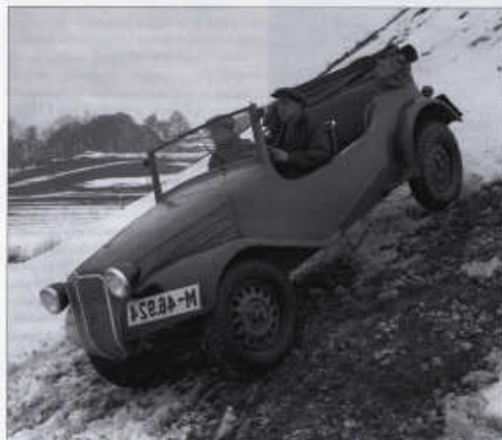
V 750 při předváděcí jízdě v terénu. Z fotografie je patrná úprava přední masky motoru, která měla zvládnout přírodní nájízové úhly