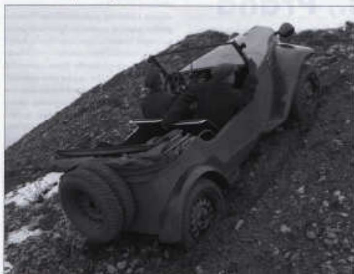
V 750 při předváděcí jízdě v terénu. Na zádi prototypu nechybí specifická vojenská výbava dvou záložních kol