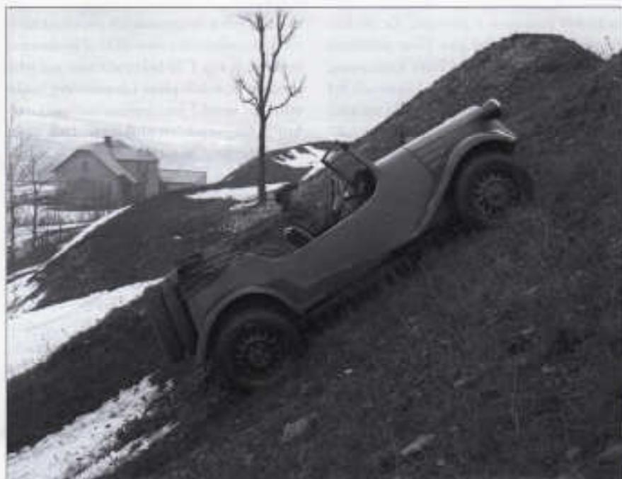
Při předváděcí jízdě V 750 zdolával bezpečně svah v značném sklonu

Vojenské dvounápravové osobní automobily s náhonem na všechna kola z let 1937 a 1938