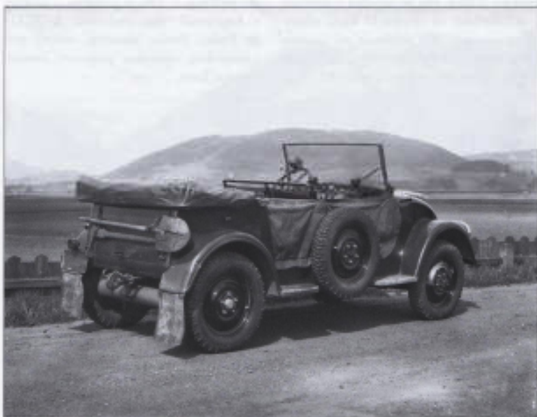
Pohled zezadu na automobil V 799 ukazuje, že vůz je s plně vybavené požadované armádou včetně uloženého nářadí – krumpáče a lopaty