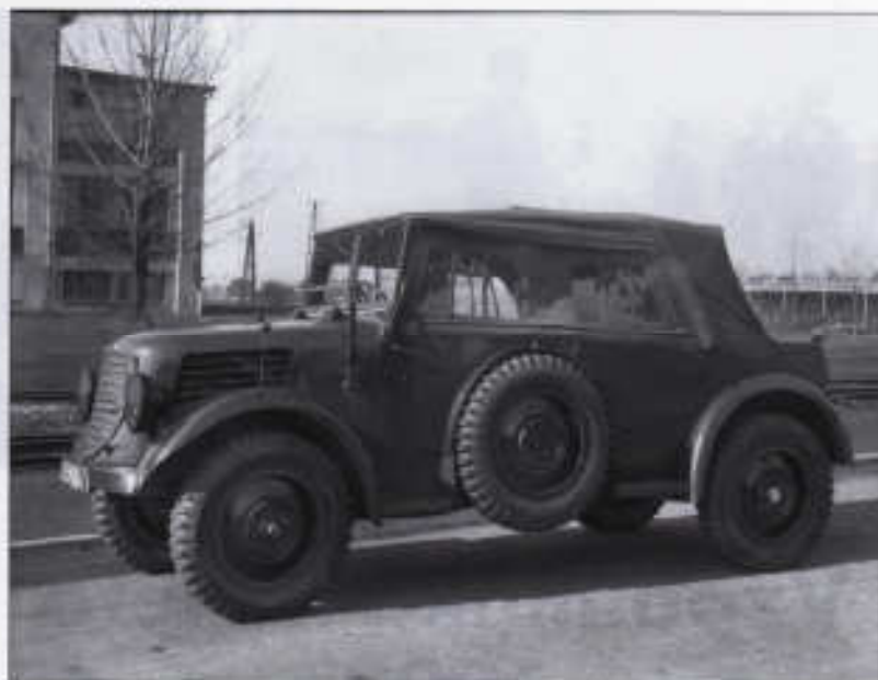
Vývoj V 799 pokračoval prototypem V 809